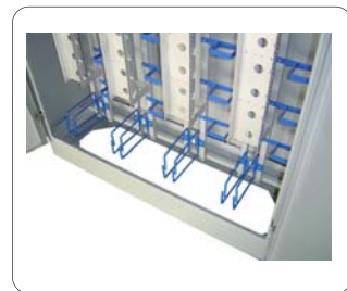
ภายในติดตั้งอุปกรณ์ได้จำนวนมาก