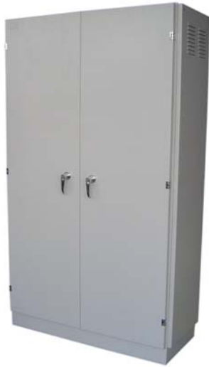
040010-040100 Indoor Floor Mount Cabinet