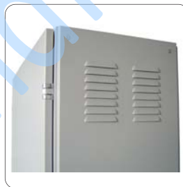
ช่องระบายอากาศติดตั้งตะแกรงกันแมลง