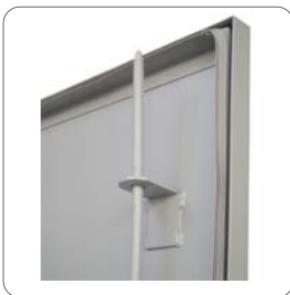
ติดตั้งกลอนยึดแน่นหนาทั้งด้านบนและด้านล่าง ประตูไม่พริ้วไหว

ตู้เอนกประสงค์ตั้งพื้น ผ่านการพ่นสีด้วยสีผงระบบไฟฟ้าสถิตย์ (Electrostatic Powder Coating System) และอบด้วยอุณหภูมิสูง 200 องศา คุณภาพสีที่ได้มีความสวยงามคงทนต่อแรงกระแทกและการขีดขูดได้เป็นอย่างดี