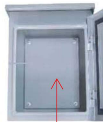
แผ่นรองอุปกรณ์ (แผ่นพลาสติก) ภายในตู้