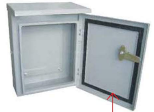
ขอบยางกันน้ำ