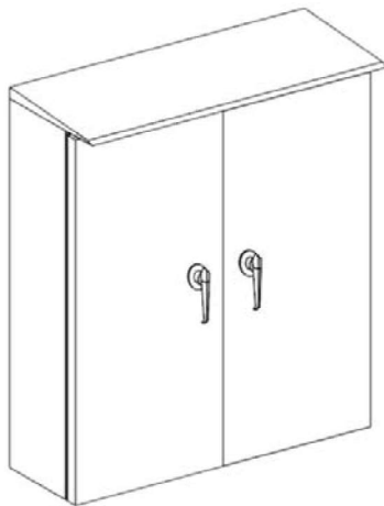
Cabinet Type 2 Doors